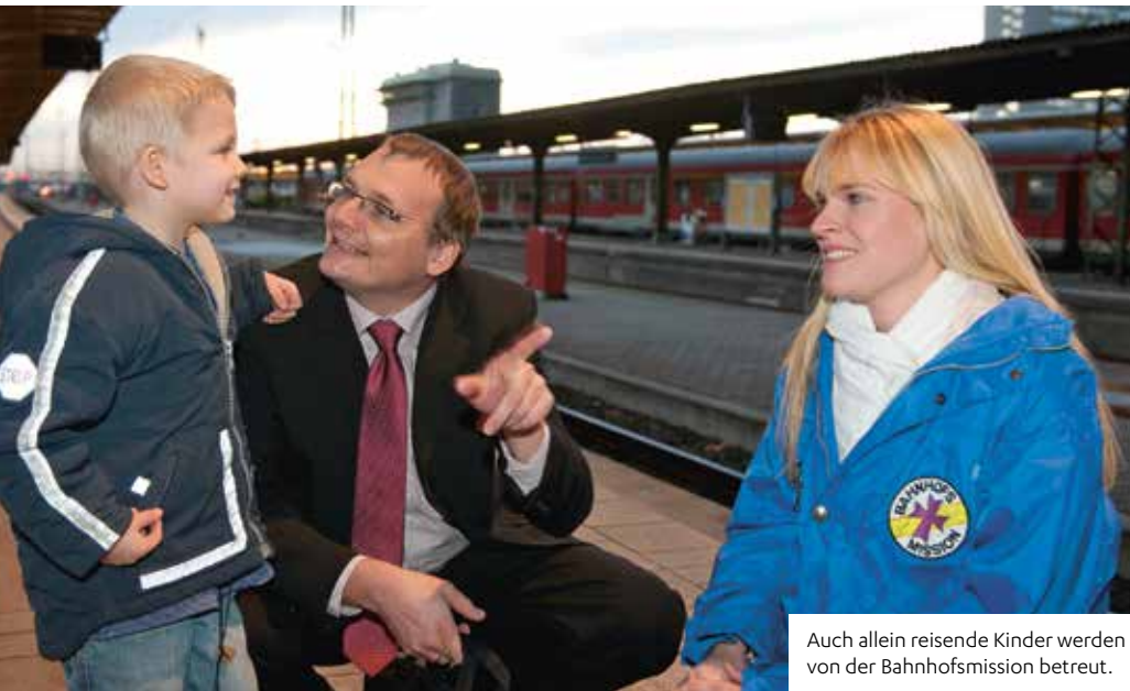
Auch allein reisende Kinder werden von der Bahnhofsmision betreut.