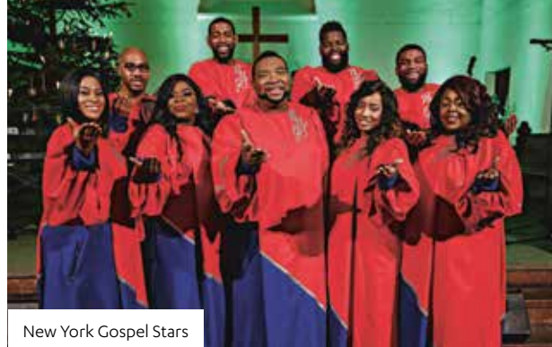
New York Gospel Stars