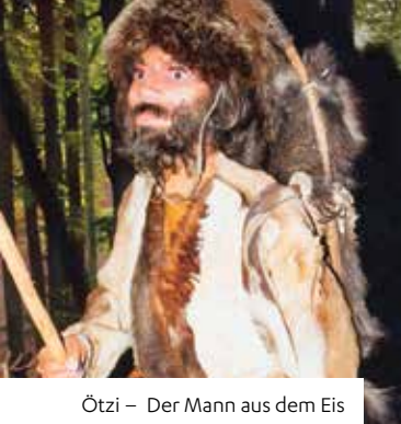
Ötzi – Der Mann aus dem Eis