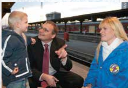
Tipps und Tricks des Bahnverkehrs Nächste Hilfe: Bahnhofsmision