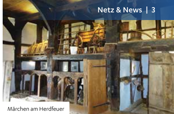
Märchen am Herdfeuer