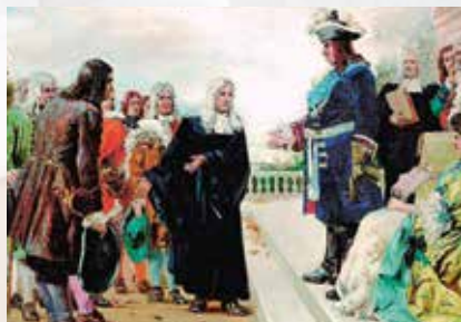
Museumspfad Bad Karlshafen Begehbare Geschichte