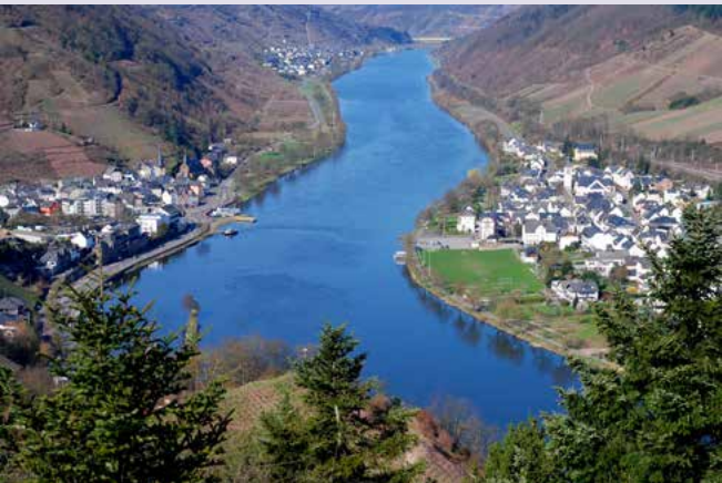
„Blaues Band“ zwischen Alf (links) und Bullay (rechts)

Vor der Weiterfahrt nach Traben-Trarbach oder nach der Wan-derung auf dem Moselweinbahn-Wanderweg können Sie sich in Bullay mit heimischem Wein und moselländischen Spezialitäten stärken. Urige Straußwirtschaften laden Sie zum Verweilen und Genießen mit wunderbaren Ausblicken und romantischer Atmosphäre ein.