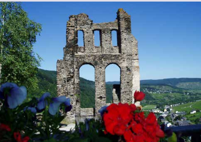
Blick auf Traben-Trarbach von der Grevenburg

Bei individuellen Weinproben, Weinbergstouren und Keller-führungen im Anbaugebiet des berühmten Mosel-Rieslings erfahren Sie gelebte Winzertradition. Eine Führung durch das mystische Halbdunkel der Traben-Trarbacher Unterwelt lädt zudem zu spannenden Entdeckungen rund um den historischen Weinbau ein, bevor Sie sich den Wein in einer der vielen gemütlichen Straußwirtschaften schmecken lassen können.