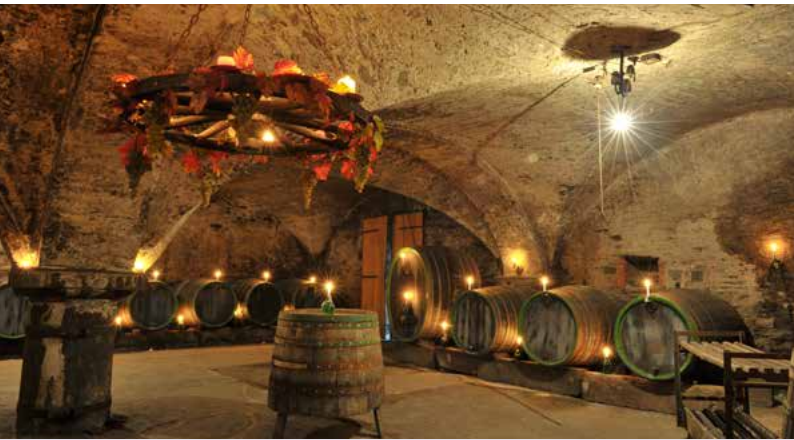
Weinkeller in Traben-Trarbach

* Deutschlandtarif Tickets und Preisstufen sind nur als Auszug dargestellt. Das vollständige Angebot finden Sie unter vrminfo.de , vrt-info.de und bahn.de oder fragen Sie die jeweilige Info-Hotline (siehe Ansprechpartner). Tarifstand VRM/DT: 01.01.2026, Tarifstand VRT: 01.03.2026