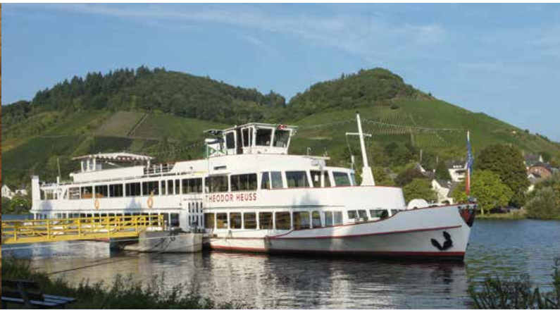
Fahrgastschiff vor Bullay

Tourist-Information Traben-Trarbach Am Bahnhof 5 56841 Traben-Trarbach Tel. 0 65 41 / 8 39 80 www.traben-trarbach.de