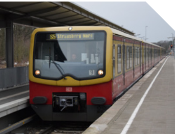
Die S5 Richtung Strausberg Nord