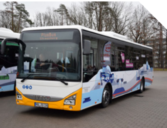
Plusbus nach Bad Freienwalde