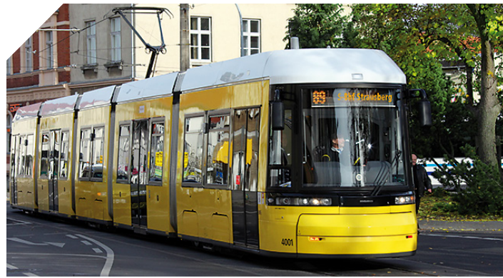
Die Tramlinie 89 Richtung S-Bahnhof Strausberg

Die Tramlinie 89 verkehrt ab Strausberg Bahnhof im Anschluss von und zur S5 in Richtung Strausberger Innenstadt zur dortigen Endhaltestelle Lustgarten. Ganz in der Nähe befindet sich der Übergang zur Straussee-Fähre, mit der man in sieben Minuten auf die gegenüberliegende Seeseite übersetzen kann. Sie ist der Ausgangspunkt für Wanderungen zum Bötzeesee, nach Spitzmühle, zum Fängersee sowie rund um den Straussee auf der Strausseepromenade. Fahrausweise gibt es auch bargeldlos auf der Fähre. Mehr unter strausbergreisenbahn.de/faehre .