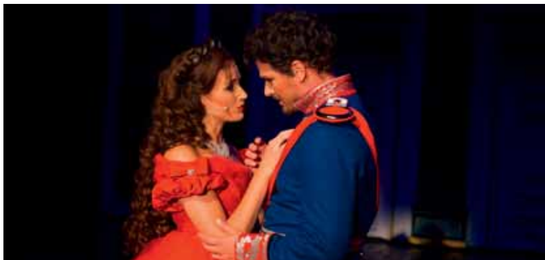
2 Ludwigs Festspielhaus Füssen www.das-festspielhaus.de