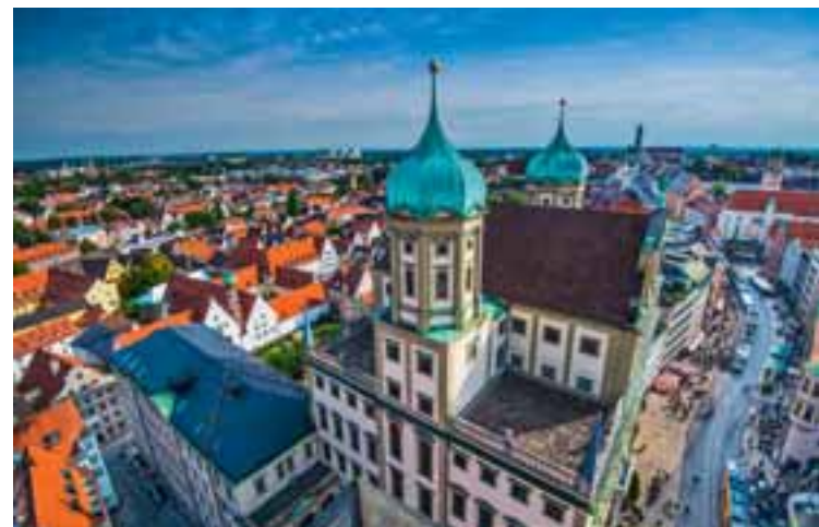
7 Augsburg www.augsburg.de