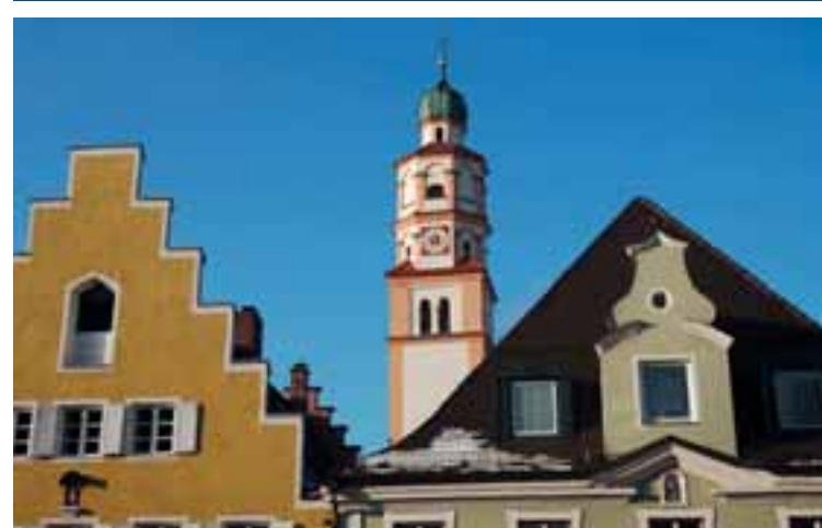
16 Schrobenhausen www.schrobenhausen.de