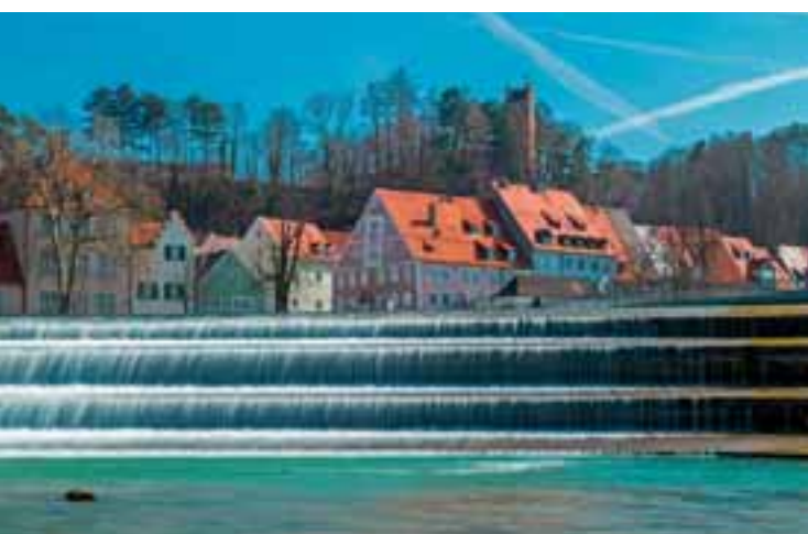
8 Landsberg am Lech www.landsberg.de