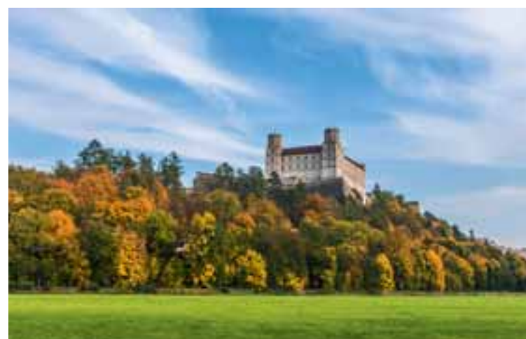
10 Willibaldsburg, Eichstätt www.schloesser.bayern.de