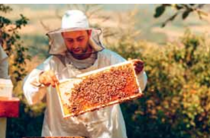
11 Bienenlehrpfad Seeg www.seeg.de