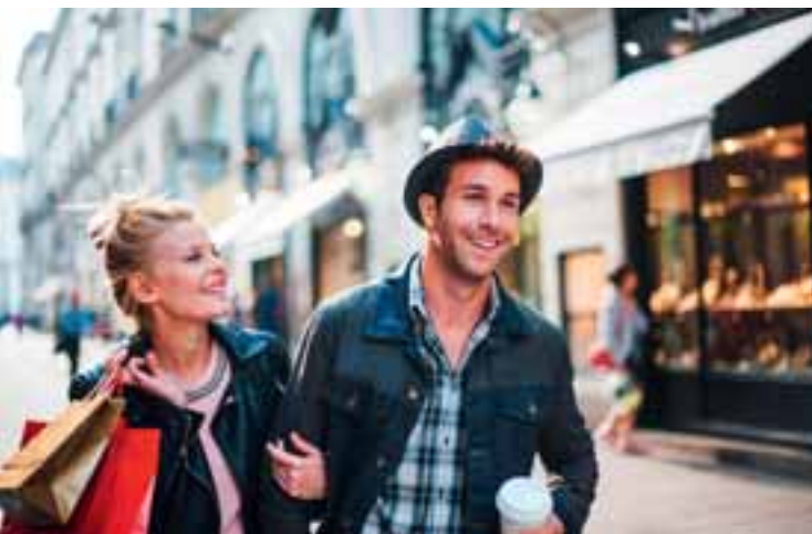
5 Shoppen im Ingolstadt Village www.ingolstadtville.com