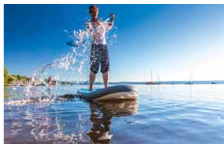
13 Wassersport am Ammersee z.B. in Dießen oder Schondorf www.ammersee-region.de