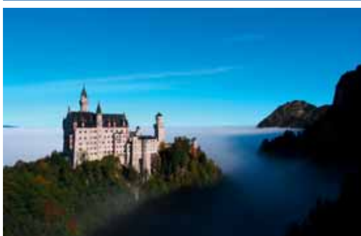
15 Schloss Neuschwanstein www.neuschwanstein.de