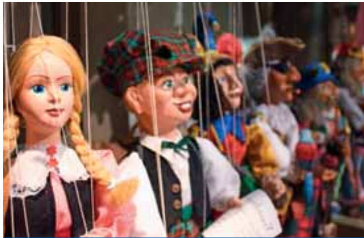
3 Augsburger Puppenkiste www.augsburger-puppenkiste.de

You don't get any discounts from the following partners – nevertheless, a visit is worthwhile!