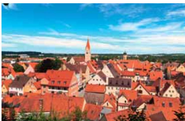
12 Kaufbeuren www.kaufbeuren.de