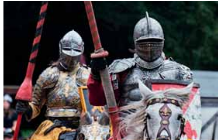
4 Kaltenberger Ritterspiele nahe Geltendorf www.ritterturnier.de