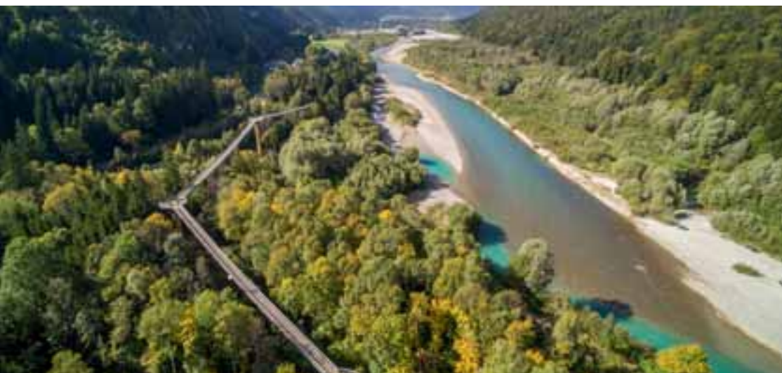
1 Walderlebniszentrum Ziegelwies www.walderlebniszentrum.eu

Get your discounts with the Guten Tag Ticket from the following two partners: