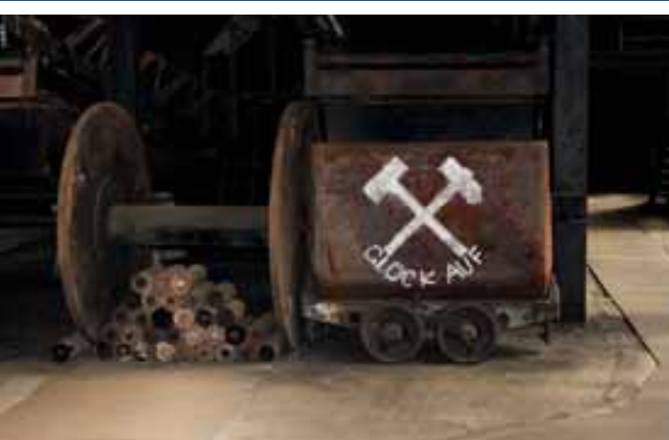
14 Bergbaumuseum mit Erlebnisbergwerk, Peißenberg www.peissenberg.de/bergbaumuseum