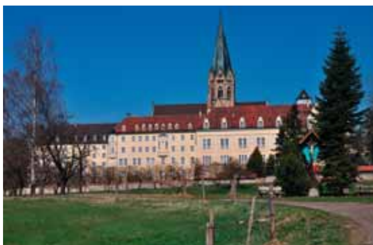
9 Erzabtei St. Ottilien www.erzabtei.de