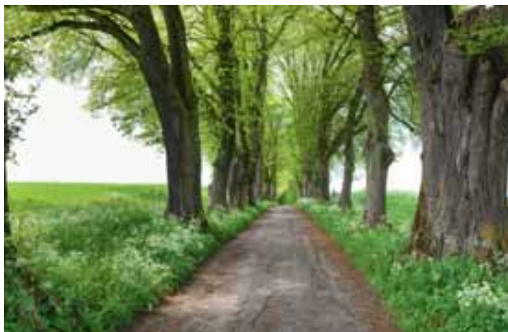
6 Lindenallee Marktoberdorf www.marktoberdorf.de