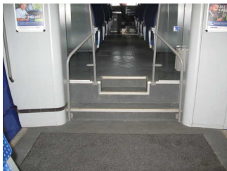
Treppe zw. Niederflur- und Hochflurbereiche