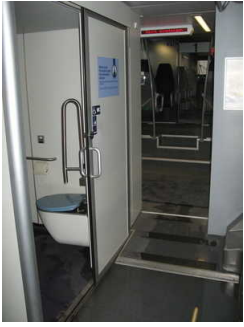
WC - Flur vom Mehrzweckbereich