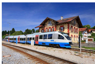
Talent; Foto Bayerische Oberlandbahn GmbH