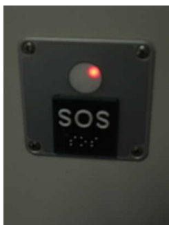
Beschriftung Innen - taktil erfassbar