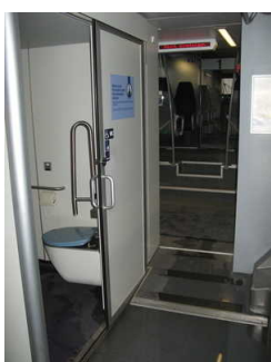
WC - Flur vom Mehrzweckbereich