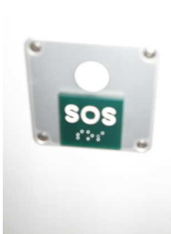
Bedienelement - taktile erfassbar