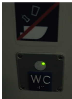
Beschriftung Innen - taktil erfassbar

Die Informationen sind in gut lesbarer Schrift vorhanden.