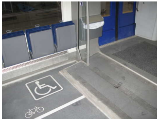
Neigung zu Rollstuhlplätzen