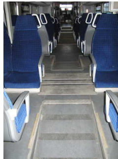
Übergänge - müssen nicht genutzt werden