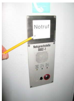
Beschriftung Innen - taktil erfassbar