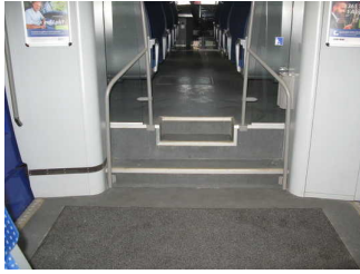
Treppe zw. Niederflur- und Hochflurbereiche